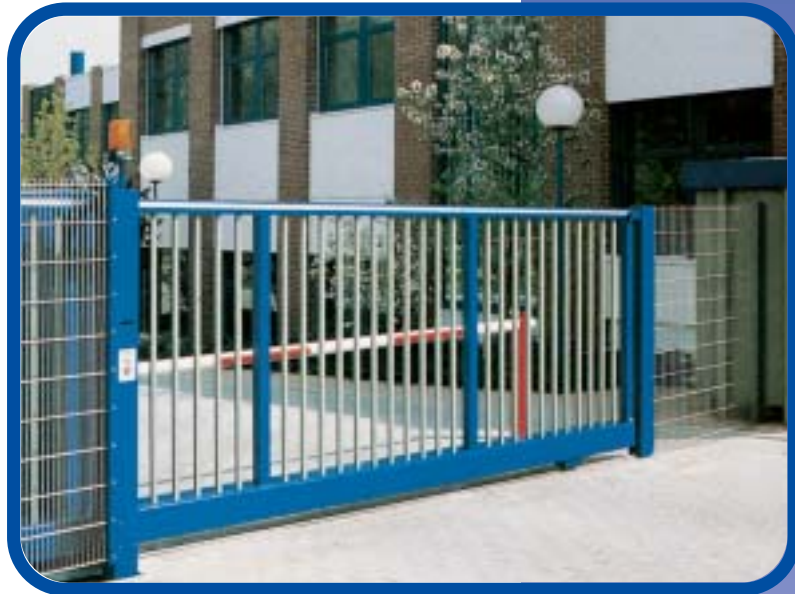
Abb. oben: Zugangslogistik und -kontrolle für Fahrzeuge und Personen mit ENGELFRIED Schiebetor, Schranke und Drehkreuz.

Richtlinien für kraftbetätigte Fenster, Türen und Tore Z H 1/494 Korrosionsschutz nach DIN 8567 oder DIN 8565 verzinkt und nach DIN 50981 beschichtet.